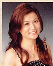
ソプラノ 鷺尾麻衣