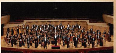
管弦楽 日本フィルハーモニー交響楽団 合唱 武蔵野合唱団

2014年11月23日(日) 午後2時開演 (午後1時15分開場) 府中の森芸術劇場 どりーむホール