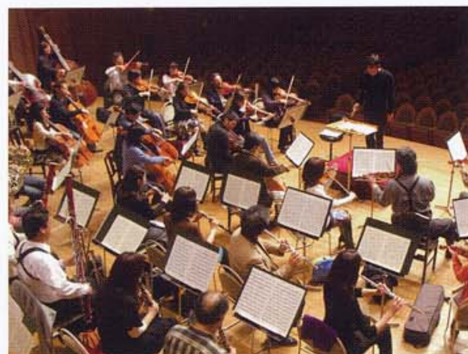
いづみホールでのリハーサル

そして今日、サントリーホールでの特別演奏会を迎える。藤岡と関西フィルでなければ実現できない音楽が、皆様の眼前に現れることを願って…。