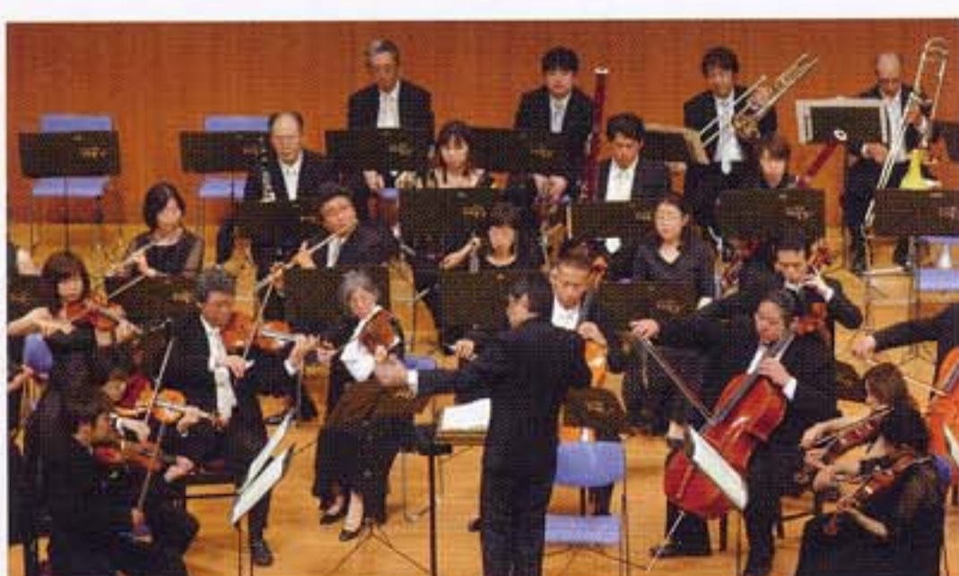
平日昼間の公演として人気の「梅田芸術劇場」シリーズ