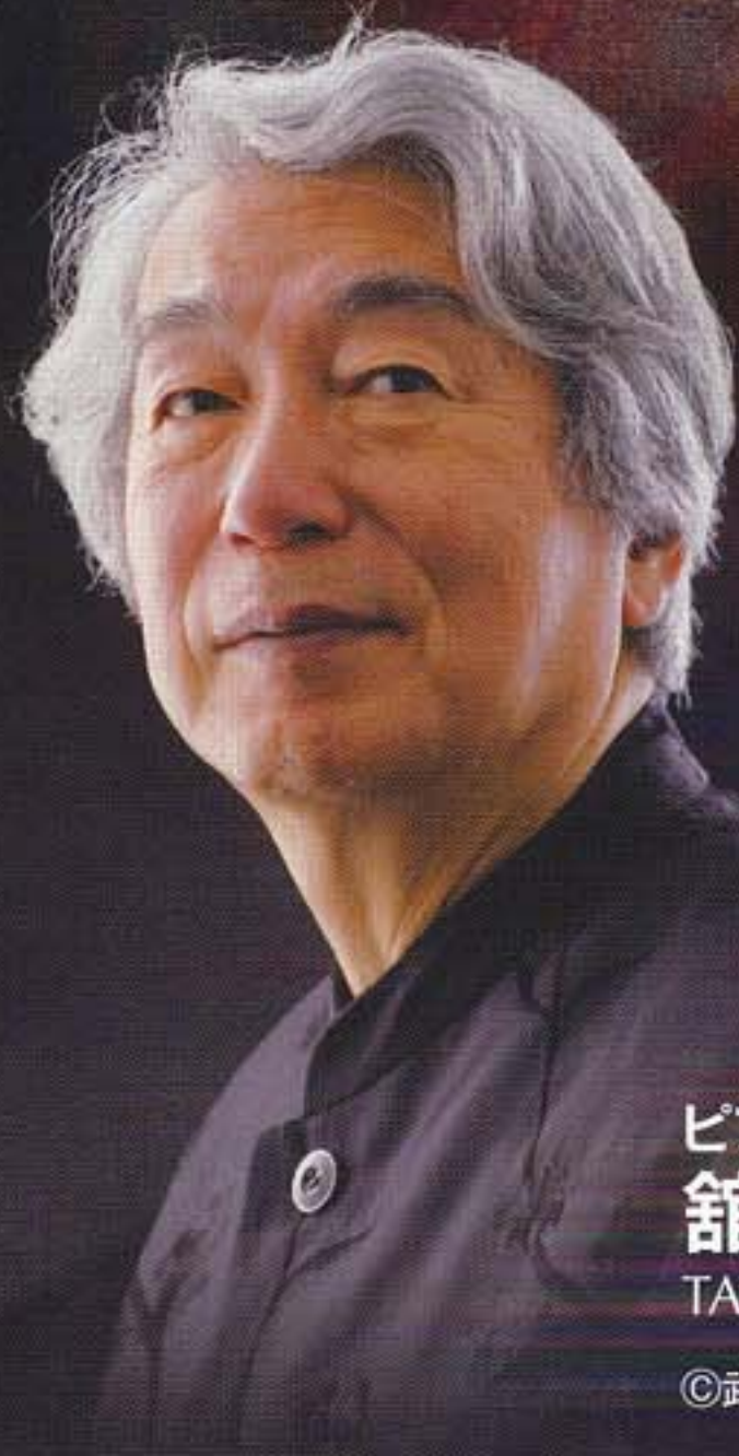
ピアノ 舘野 泉 TATENO Izumi, Piano