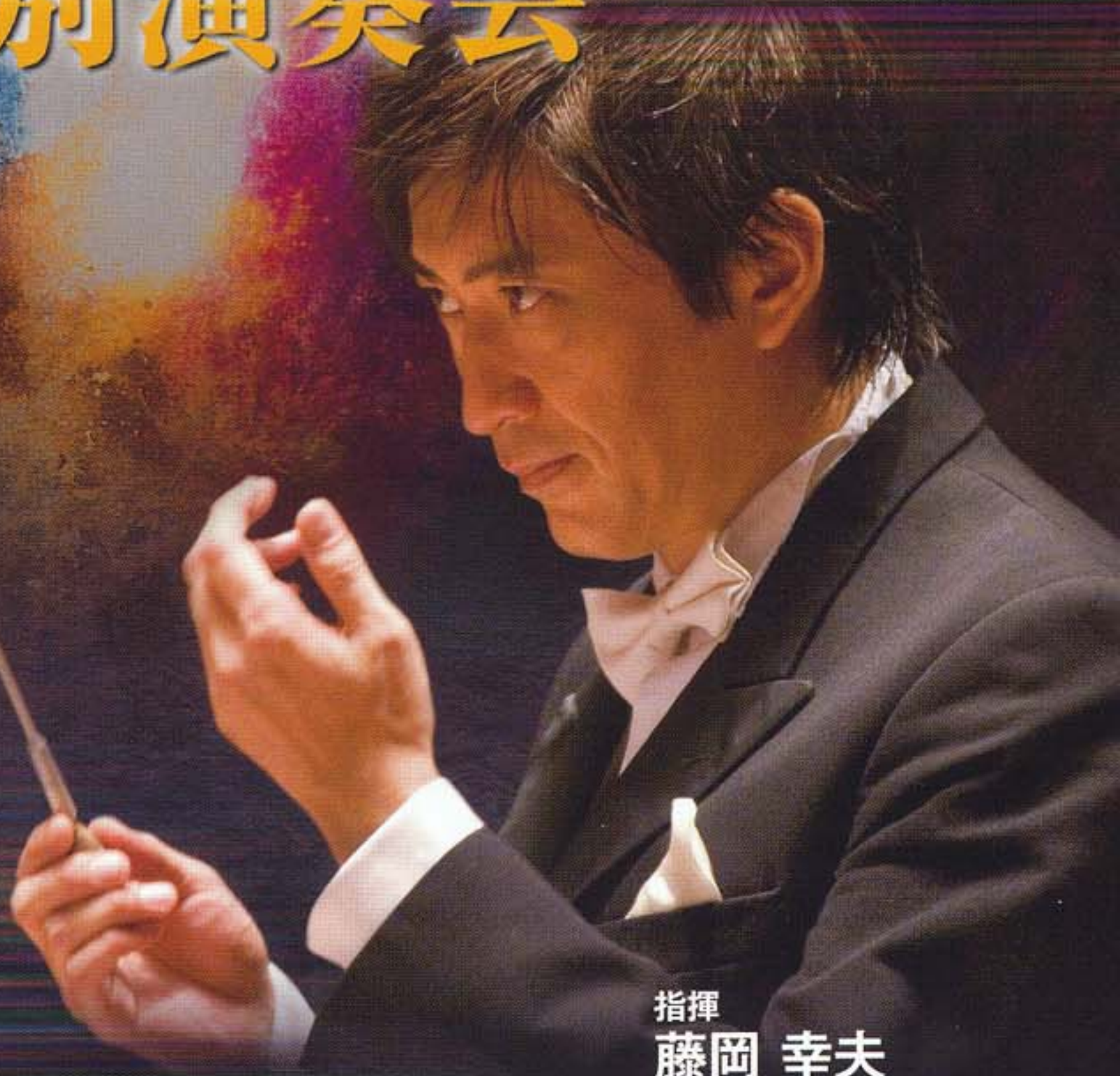
指揮 藤岡 幸夫 関西フィル首席指揮者 FUJIOKA Sachio, Conductor