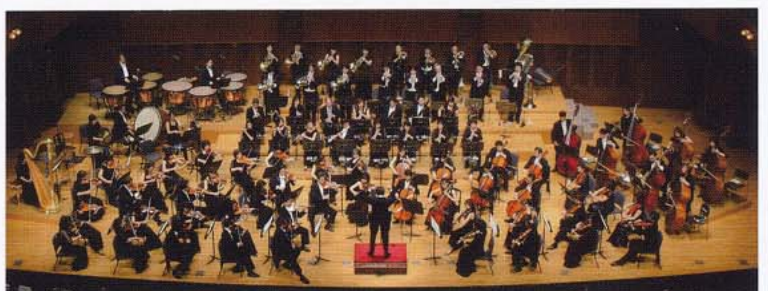
2007年4月29日 首席指揮者就任披露公演