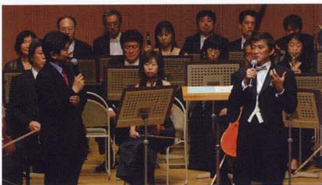
クラシックの裾野を広げる「Meet the Classic」シリーズ