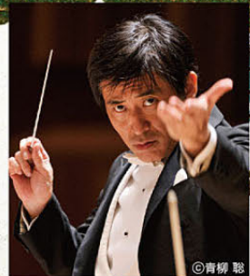
指揮：藤岡 幸夫 FUJIOKA Sachio, Conductor