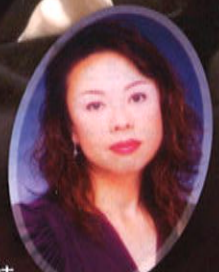
福原寿美枝 (メゾ・ソプラノ)